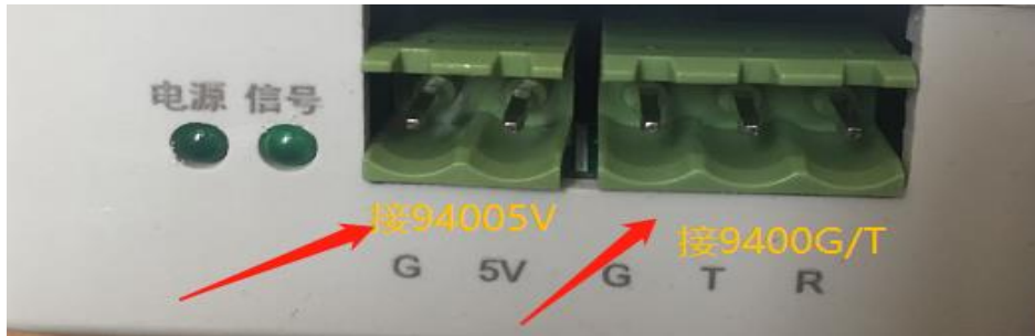
(图 4 转换板卡与网关对应接口)

接口 2 为网关给并口数据转换板卡供电口，输出电压为 5V； 接口 3 中，其中 G 对应并口数据转换板卡上的 G，T 对应 T； 转换板卡具体接法如下图：