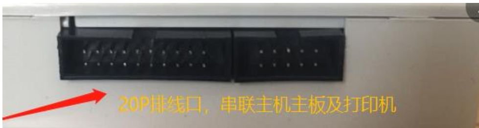
(图 5 转换板卡与主机及打印机对应接口)