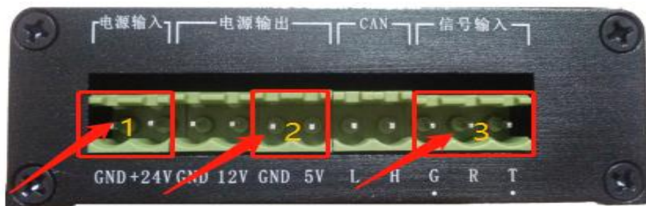
(图3 网关、转换板卡供电接口，信号输入口)