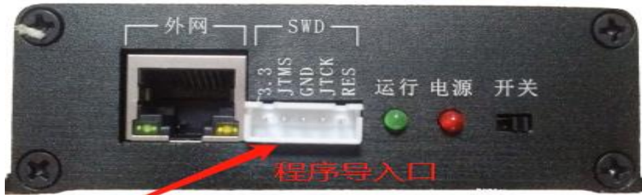
(图二：网关程序导入接口)